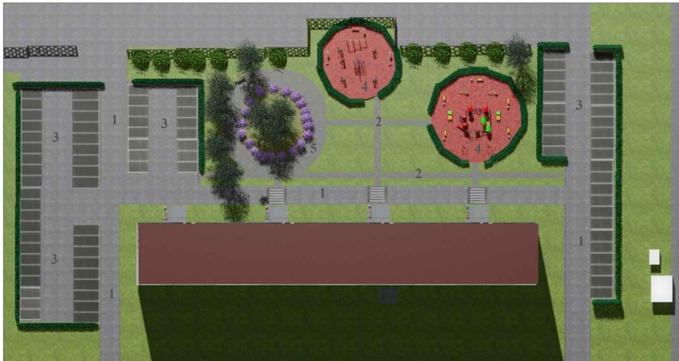
Схема благоустройства дворовой территории д.3 по ул.Пионерская в г.Кировск Ленинградской области